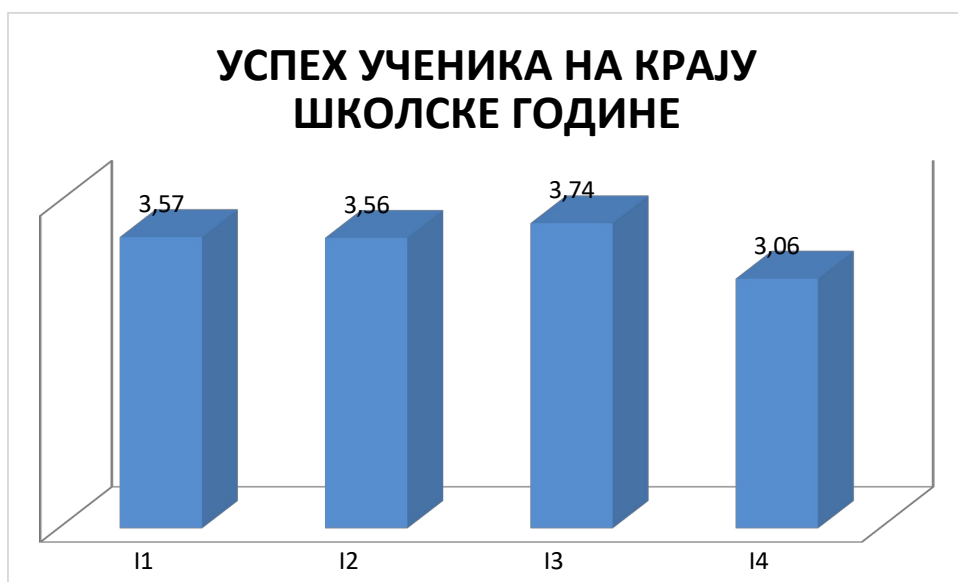
ГРАФИКОН бр.1: Успех ученика првог разреда

Средња оцена успеха ученика првог разреда је добар 3,48. Највише је врло добрих 46,48%, а потом добрих ученика – 43,66%, 4,22% су одлични и 4,22% довољни, а један ученик није завршио разред. Врло добар успех имају ученици смера РПТ 3,74, а подједнак пољопривредни техничари диг. тех. и ветеринарски техничари 3,57, односно 3,56. Успех ученика првог разреда је ове школске године бољи у односу на претходну годину (када је износио 3,02).