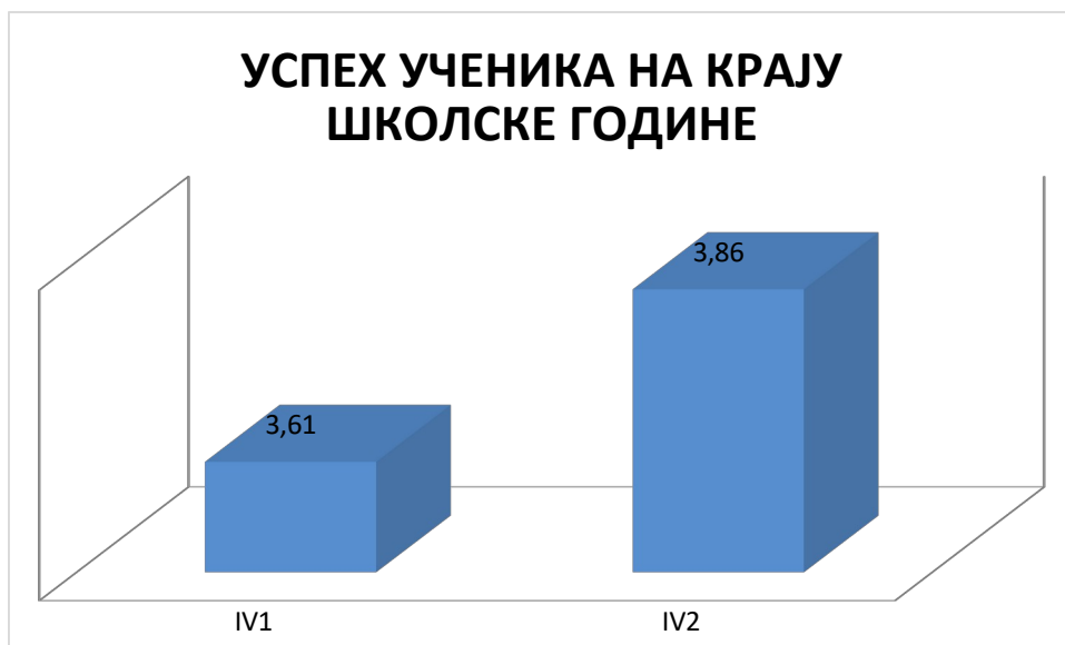
ГРАФИКОН бр.4: Успех ученика четвртог разреда

Ученици четвртог разреда имају просечну оцену успеха на крају школовања врло добар 3,73 (било3,51). Подједнак проценат ученика је завршиио разред са одличним и врло добрим успехом 27,08%, односно 29,17%, потом са добрим успехом 41,67%, довољних је 2,08% .