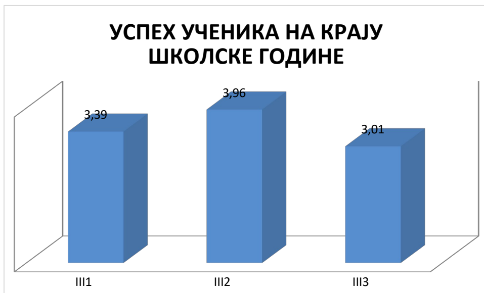
ГРАФИКОН бр. 3 : Успех ученика трећег разреда

Када погледамо успех ученика трећег разреда примети се да III-2 ветер. тех., имају највећу просечну оцелу - врло добар 3,96, а пољопривредни техничари имају средњу оцелу одељења 3,39 добар, као и одељење завршног разреда трећег степена 3,01. Највише је добрих ученика 41,67%, затим врло добрих 35,42% , одличних је 16,67%, довољних 4,17%, а један ученик није завршио разред. Просечна оцелу успеха за трећи разред је врло добар 3,45, исто као и претходне године (било 3,46).