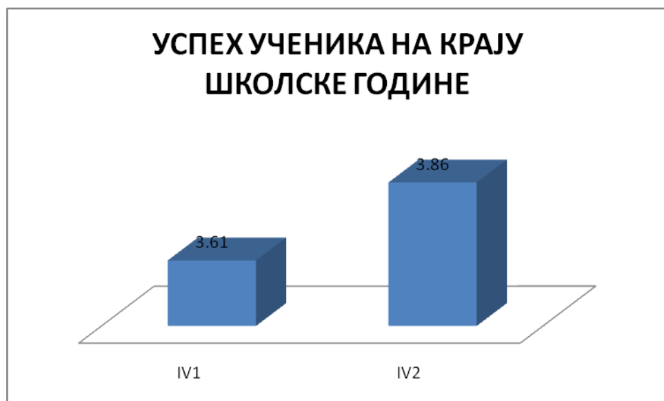
ГРАФИКОН бр.4: Успех ученика четвртог разреда

Ученици четвртог разреда имају просечну оцену успеха на крају школовања врло добар 3,73 (било 3,51). Подједнак проценат ученика је завршио разред са одличним и врло добрим успехом 27,08%, односно 29,17%, потом са добрим успехом 41,67%, довољних је 2,08% .