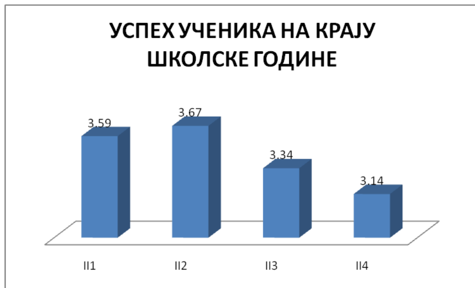
ГРАФИКОН бр. 2: Успех ученика другог разреда

Средња оцена успеха ученика другог разреда је добар 3,43, мало боље у односу на прошлу годину (било 3,26). Највише је ученика са добрим успехом 45,00%, потом врло добрих-36,67%, одличних је 8,33%, док је довољних 3,33% , а недовољних 6,67%. Најбоље одељење је II-2, ветеринарски техничари са општим успехом врло добар 3,67.