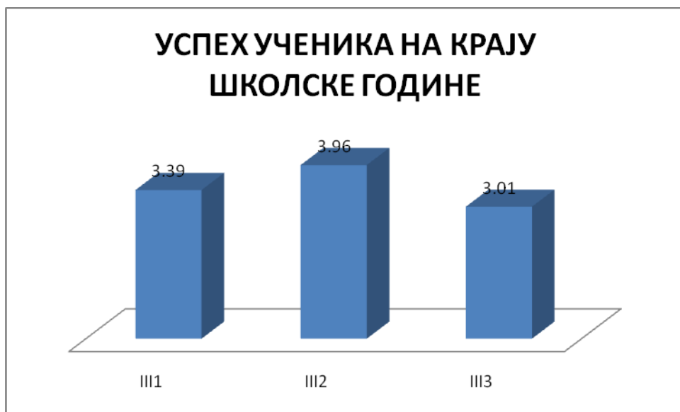
ГРАФИКОН бр. 3 : Успех ученика трећег разреда

Када погледамо успех ученика трећег разреда примети се да III-2 ветер. тех., имају највећу просечну оцену - врло добар 3,96, а пољопривредни техничари имају средњу оцену одељења 3,39 добар, као и одељење завршног разреда трећег степена 3,01. Највише је добрих ученика 41,67%, затим врло добрих 35,42% , одличних је 16,67%, довољних 4,17%, а један ученик није завршио разред. Просечна оцена успеха за трећи разред је врло добар 3,45, исто као и претходне године (било 3,46).